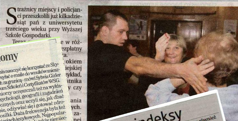
Strażnicy miejscy i policjanci przeszkolili już kilkadziesiąt pań z uniwersytetu trzeciego wieku przy Wyższej Szkole Gospodarki.

KURS Musisz wracać po zmroku do domu? Boisz się, że padniesz ofiarą bandyty? Policjanci i strażnicy miejscy nauczą cię, jak się bronić.